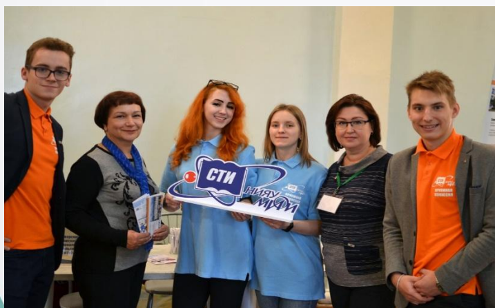
Ярмарка учебных мест