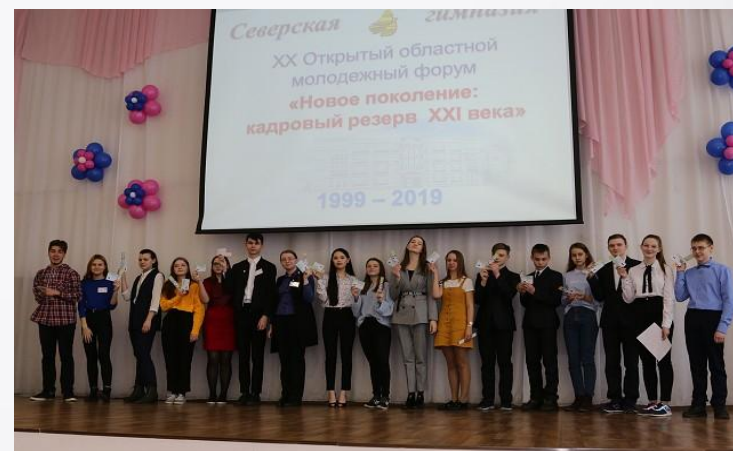
Открытый областной молодежный форум «Новое поколение: кадровый резерв XXI века 2019»